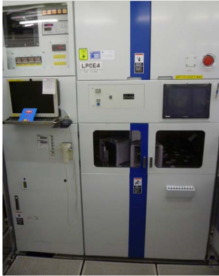
Main Frame Front